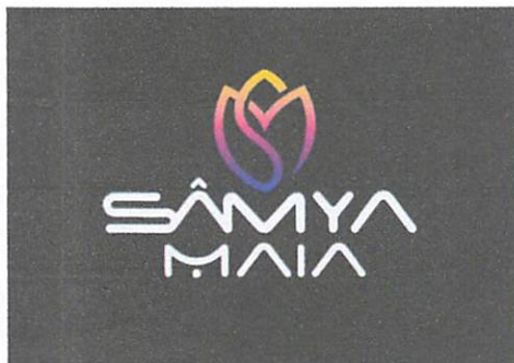
Imagem Digital da Marca

A eventual deformação desta imagem, com relação à constante do arquivo originalmente anexado, terá sido resultado da necessária adequação aos padrões requisitados para a publicação da marca na RPI. Assim, a imagem ao lado corresponde ao sinal que efetivamente será objeto de exame e publicação, ressalvada a hipótese de substituição da referida imagem decorrente de exigência formal. Portanto, se a mesma não corresponder à imagem desejada para registro nesse Órgão, substitua-a, antes de finalizar o Pedido/Petição, observando as especificações constantes do Manual do Usuário.